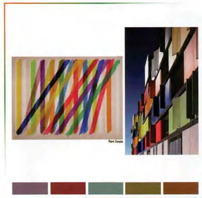
Piero Dorazio / contemporary

Egon Schiele (1890-1918) / metropolitan Pittore ed incisore austriaco d'avanguardia dal tratto moderno, tagliente, inquieto. I disegni che stanno in questo mondo ricordano le tecniche dell'incisione. I colori sono prevalentemente freddi, rimandando ai colori delle chine e agli inchiostri.