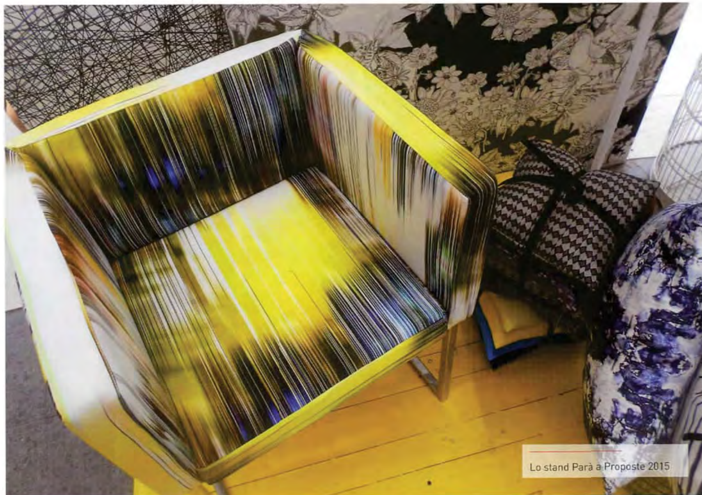
Lo stand Parà a Proposte 2015