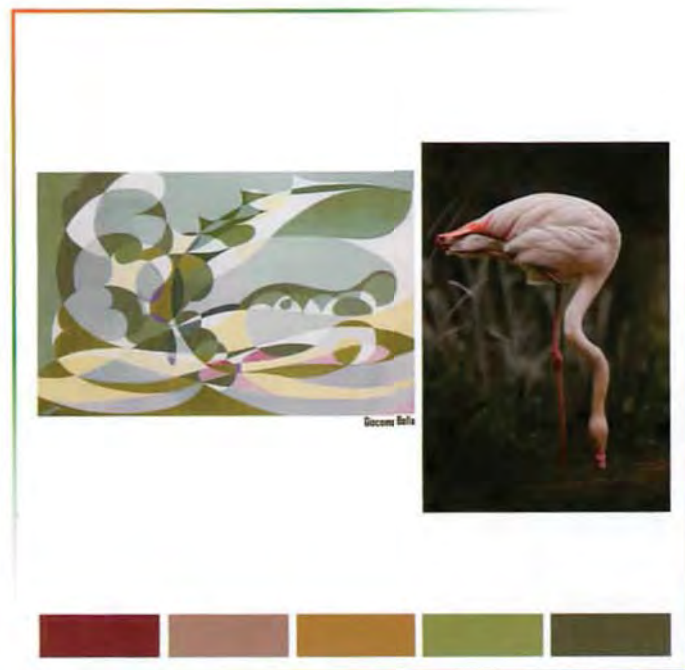
Giacomo Balla / sophisticated