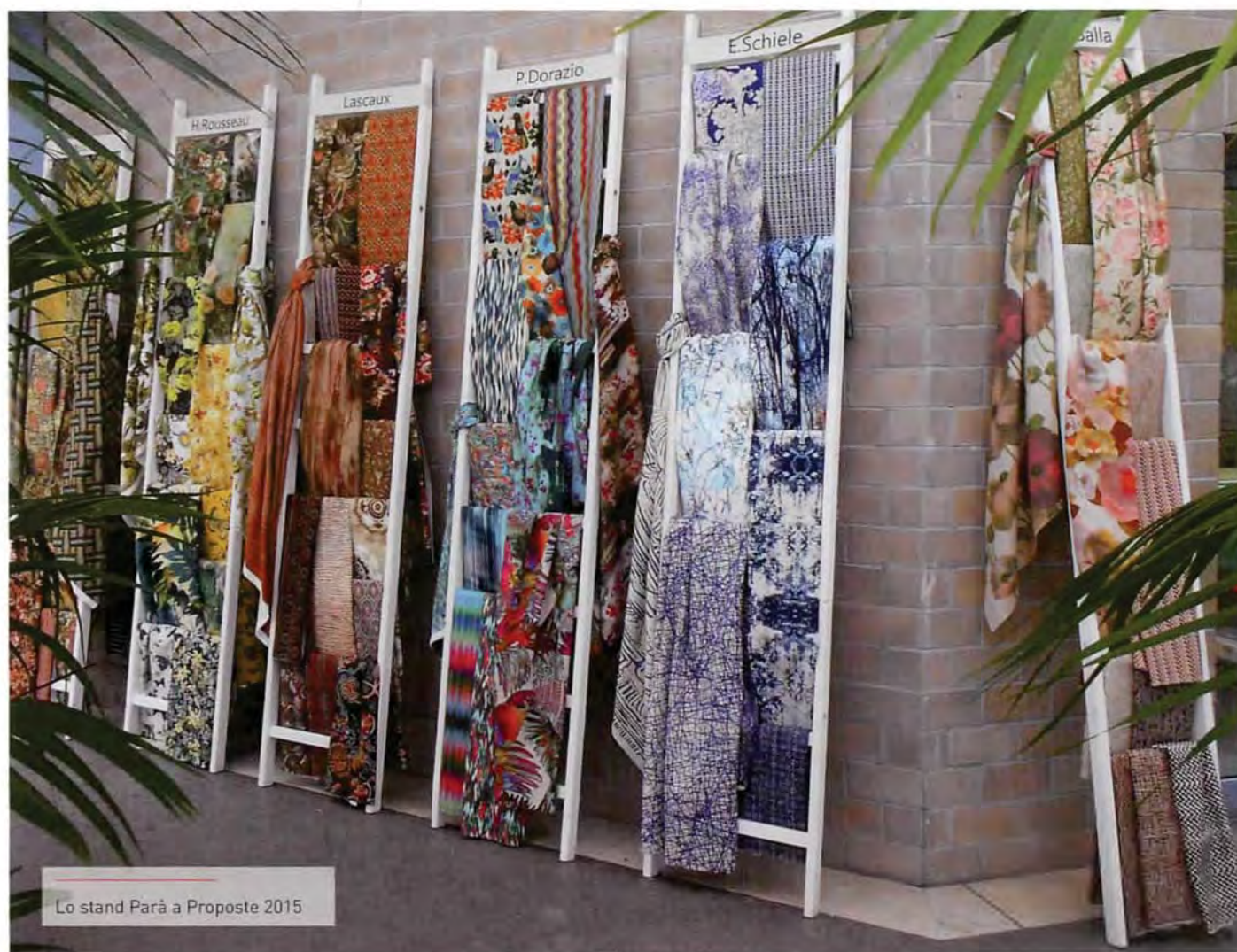
Lo stand Parà a Proposte 2015

L'ispirazione della collezione Parà 2015/2016, presentata in occasione della manifestazione Proposte, è il mondo dell'arte pittorica. A questo proposito sono stati scelti sei artisti, uno per sezione. Disegni tessili anche molto diversi tra loro rimandano alla poetica pittorica di ogni artista scelto per tema, tratto, colore o tecnica. Ciascun capitolo viene caratterizzato da una palette colore dedicata che fa sì che ogni tema sia unico e ben caratterizzato. Nei disegni come sempre si alternano diverse tecniche espressive che esaltano la peculiarità della stampa digitale. "Abbiamo riscontrato che lavorando su più disegni e meno varianti il ritorno commerciale è più proficuo, per questo quasi tutti i disegni saranno mono variante e solo in pochi casi, quando creano una coordinabilità saranno declinati in più varianti colore" dichiarano da Parà, nel dettaglio vediamo le caratteristiche dei nuovi disegni: