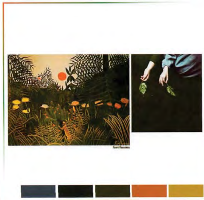
Henri Rousseau / flowergarden