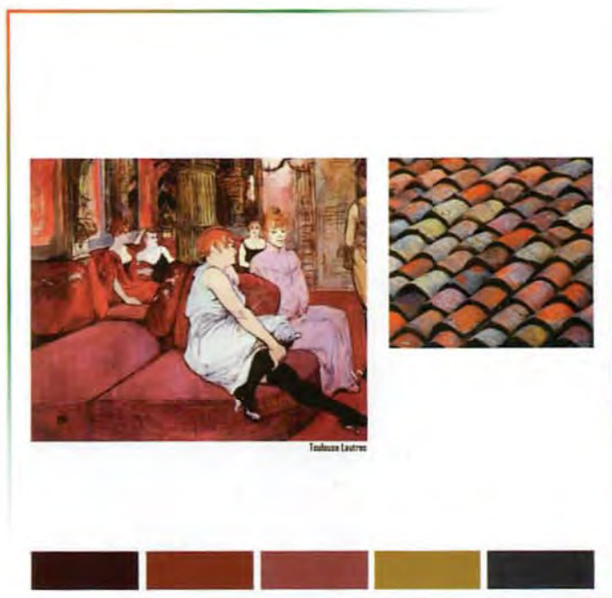
Toulouse Lautrec / etno kilim