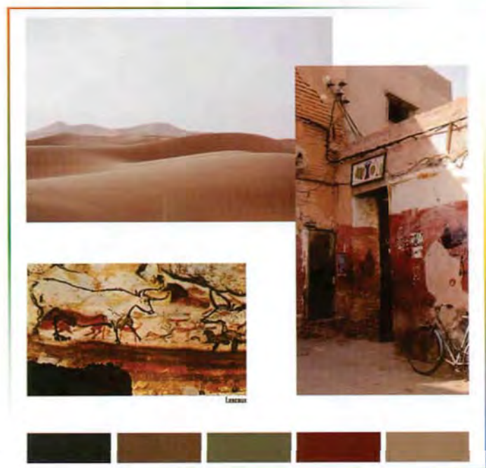
Lascaux / etno chic