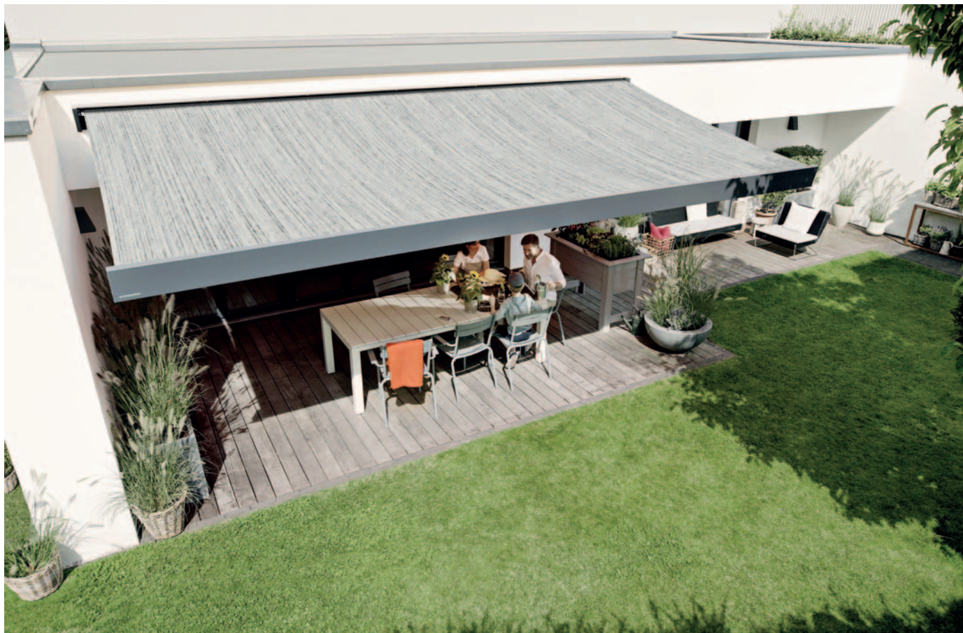
Tempotest® Starlight blue XL, tessuto sostenibile in PET riciclato in versione grande altezza (325 cm). Tutte le immagini courtesy Parà