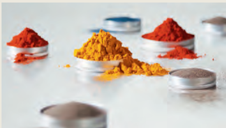
Processo di tintura in massa