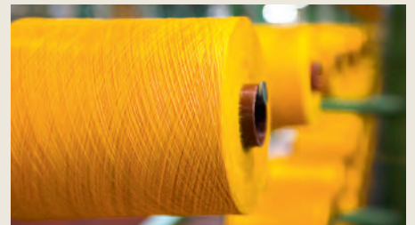
Il filo viene avvolto su bobine