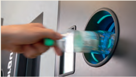
Raccolta delle bottiglie in PET