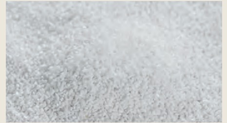
Fusione della plastica e produzione dei chips