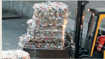
Selezione e lavaggio della materia prima