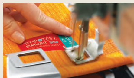
Dal tessuto alla tenda da sole

Il fattore di protezione UPF 50+ garantisce la massima protezione ai raggi UV e un maggiore ciclo di vita del prodotto . Il finissaggio Teflon Extreme by Parà, rende i tessuti idro e olio repellenti, imputrescibili e anti macchia.