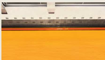
Tessitura e finissaggio