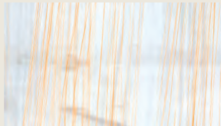
Dalla massa fusa alle singole fibre